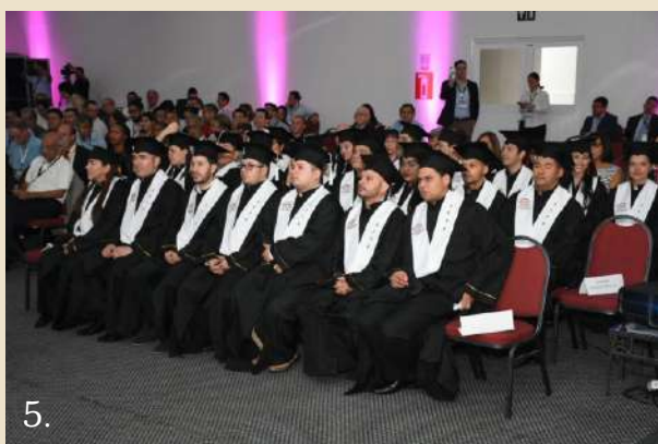
Foto 5: Cirujanos que ingresan como nuevos miembros activos de la Asociación Colombiana de Cirugía.